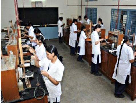
నుంచి ఉన్నతాధికారులు ప్రాక్టికల్ పరీక్షలను పర్యవేక్షించనున్నారు. ప్రాక్టికల్ మార్కులు కీలకమే రాష్ట్రంలో ప్రైవేట్, ప్రభుత్వ జూనియర్ కళాశాల విద్యార్థులకు ప్రాక్టికల్ చేయకుండానే ప్రాక్టికల్ పరీక్షలకు హాజరవుతున్నారనే ఆరోపణలు ఉన్నాయి. గ జూనియర్ కళాశాలల్లో ఎక్కువగా థియరీపైనే దృష్టి

తొలి అక్షరం/హైదరాబాద్, ఫిబ్రవరి 2: రాష్ట్రవ్యాప్తంగా మంగళవారం నుంచి ఇంటర్మీడియట్ ప్రాక్టికల్ పరీక్షలు ప్రారంభం కానున్నాయి. ఈ నెల 22 వరకు ఇంటర్ ద్వితీయ సంవత్సరం విద్యార్థులకు ప్రాక్టికల్ పరీక్షలు నిర్వహించనున్నారు. ఉదయం 9 గంటల నుంచి మధ్యాహ్నం 12 గంటల వరకు, మధ్యాహ్నం 2 నుంచి సాయంత్రం 5 వరకు ప్రాక్టికల్ పరీక్షలు జరుగుతాయి. గతంలో ఎన్నడూ లేనివిధంగా ఈ సంవత్సరం మొదటి సారి సీసీ కెమెరాల నిఘాలో ప్రాక్టికల్ పరీక్షలు నిర్వహిస్తున్నారు. ఇంటర్ ప్రాక్టికల్ పరీక్షలకు రాష్ట్రవ్యాప్తంగా 208 కేంద్రాలు ఏర్పాటు చేశారు. జూనియర్ కళాశాలల్లో ఏర్పాటు చేసే సీసీ కెమెరాలను ఇంటర్మీడియట్ బోర్డు కార్యాలయంలోని కమాండ్ కంట్రోల్ కేంద్రానికి అనుసంధానం చేశారు. కమాండ్ కంట్రోల్ కేంద్రం