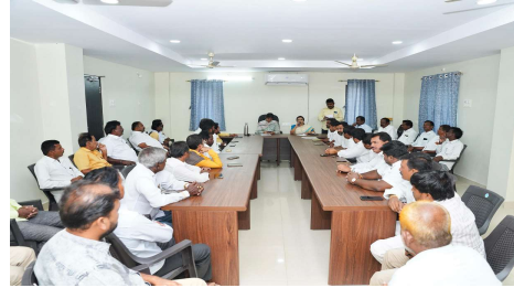
నాయకులు, గ్రామ ముఖ్య నాయకులు, ప్రజలు పాల్గొన్నారు.