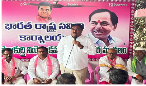
ఇబ్బంది పెడతానడానికి సిగ్గు లేదాకనీసం ఇప్పటికైనా ఆ ప్రజలకు ఇంత ఇబ్బంది జరుగుతుంటే ఒక్కసారిగా వాళ్ళని కలిసారా వాళ్ళతో మాట్లాడారా ఇప్పటికీ కూడా ఆ భూములపై కన్నేసిన మాట మార్చే కన్నీటిని కలిపి రైతులకు ఇబ్బంది అయితే ఆ భూములను తీసుకొమ్మ అని ఒక్క మాట అయినా మాట్లాడారా అక్రమంగా

లంబాడిలు తరలిరావాలన్న మాజీ మంత్రి ఎర్రబెల్లి తొలి అక్షరం/పెద్దపంగర, నవంబర్ 24: మాజీ మంత్రి ఎర్రబెల్లి దయాకర్ రావు మాట్లాడుతూ రేవంత్ నువ్వు అబద్ధాలు.. మోసపు మాటలతో అధికారం లోకి వచ్చిన ముఖ్యమంత్రివి అబద్ధాలతో అధికారంలోకి వచ్చిన రేవంత్ సర్కార్ ఇంకా అబద్ధాలతోనే కాలం గడుపుతున్నాడు. లగవర్ల లో జరిగిన ఘటనపై మాట మార్చిన రేవంత్ సర్కార్ తన సొంత నియోజకవర్గ లగవర్ల రైతుల భూములు అక్రమించుకునే ప్రయత్నం చేసిన రేవంత్ సర్కార్ కి అక్కడి రైతులు గట్టిగానే సమాధానం చెప్పడంతో వారికి అందగా కేటీఆర్ చేపట్టిన మహా ధర్మాకి భయపడి మాట మార్చిన రేవంత్ రెడ్డి అక్కడ ఏర్పడేది ఫార్మాసిటీ కాదు ఇండస్ట్రియల్ కారిడార్ అనే మాట మార్చిన రేవంత్ రెడ్డి ప్రజలను ఇప్పటికీ అబద్ధాలతోనే మోసం చేస్తున్నాడు తన సొంత నియోజకవర్గ ప్రజలను నేనెందుకు