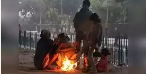
నుంచి బయటకు వెళ్లే ఉద్యోగిస్తులు వణికిపోతున్నారు. హైదరాబాద్ నగర శివారులోని ఇబ్రహీంపట్నంలో రికార్డ్ స్థాయిలో 11.4 డిగ్రీల ఉష్ణోగ్రత నమోదైంది. రాజేంద్రనగర్ లో 12.4, BHEL లో 12.8 డిగ్రీల ఉష్ణోగ్రత నమోదైంది. వస్తే వారం రోజుల్లో చలి తీవ్ర మరింత పెరిగే ఛాన్స్ ఉందని వాతావరణశాఖ అధికారులు హెచ్చరించడంతో జనం వణికిపోతున్నారు. ఎముకలు కొరికే చలితో నరకం చూడటం గ్యారంటీ అని బెంబేలెత్తిపోతున్నారు. హైదరాబాద్ తో పాటు ఉత్తర తెలంగాణ జిల్లాలలో కనిష్ట ఉష్ణోగ్రతలు 2 నుంచి 3 డిగ్రీలు తగ్గాయని వాతావరణ శాఖ

తొలిఅక్షరం/హైదరాబాద్, నవంబర్ 20 : హైదరాబాద్ వాసులకు హెచ్చరికే.. రాబోయే వారం రోజుల పాటు ఎముకలు కొరికే చలి గ్యారంటీ.. ఇప్పటికే గత రెండు మూడు రోజుల నుంచి సిటీతో పాటు నగర శివారుని కోల్డ్ వేప్స్ కమ్మోతాయి. ఇదే వెదర్ మరో ఏడెనిమిది రోజుల పాటు ఉంటుందని వాతావరణశాఖ అధికారులు హెచ్చరిస్తున్నారు. దీంతో ఇటు చలి..మరోవైపు సీజనల్ వ్యాధులు విజృంభించే ఛాన్స్ ఉండటంతో నగరవాసులు బెంబేలెత్తిపోతున్నారు. హైదరాబాద్ పై చలి వగబట్టింది. జంటనగరాల్లో చలి తీవ్రత పెరిగింది. నగరశివారుల్లో గత రెండు, మూడు రోజుల నుంచి కోల్డ్ వేప్స్ వణికిస్తున్నాయి. ఇది మరో వారం రోజుల పాటు కొనసాగే అవకాశం ఉంది. చలి తీవ్రత మరింత పెరిగే అవకాశం ఉందని వాతావరణశాఖ అధికారులు హెచ్చరిస్తున్నారు. దీంతో ఉదయం పూట మార్కెట్ వాకర్స్, ఇంటి