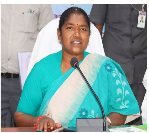
కానిస్టేబిల్ ఛార్జీలు గ్రీన్ ఛానల్ ద్వారా చెల్లిస్తామని మంత్రి సీతక్క హామీ ఇచ్చారు. డైట్ ఛార్జీలు ఏడేళ్లుగా, కానిస్టేబిల్ ఛార్జీలు గత 16 సంవత్సరాలూ పెరగలేదని అన్నారు. ఏడు సంవత్సరాల క్రితం డైట్ ఛార్జీలు కొంచెం పెంచే.. బీఆర్ఎస్ ప్రభుత్వం ప్రచారం

తొలి అక్షరం/హైదరాబాద్, నవంబర్ 1: తెలంగాణలో గురుకులాలకు డైట్, కానిస్టేబిల్ ఛార్జీలు పెరిగాయి. 40శాతం మేర పెంచినట్లు మంత్రి సీతక్క వెల్లడించారు. ఎన్నడు లేని విధంగా హాస్టల్, గురుకుల విద్యార్థులకు డైట్ కానిస్టేబిల్ 40శాతం పెంచారని గుర్తుచేశారు. శుక్రవారం సచివాలయంలో మంత్రి సీతక్క మీడియా సమావేశంలో మాట్లాడుతూ... ఎన్నడూ లేని విధంగా విద్యార్థులకు 40శాతం ఛార్జీలను పెంచిన సీఎం రేవంత్ రెడ్డికి ధన్యవాదాలు తెలిపారు. పెంచిన ఛార్జీలు అందుకుంటున్న విద్యార్థులందరికీ శుభాకాంక్షలు తెలిపారు. ఇదే విద్యార్థులకు అసలైన దీపావళి అని మంత్రి సీతక్క వ్యాఖ్యానించారు. ఇక హాస్టల్ విద్యార్థుల అర్థాకలితో అవస్థలు పడుతున్న అవసరం లేదని చెప్పారు. పెంచిన ఛార్జీలతో విద్యార్థులకు పోషకాహారం అందించాల్సిన బాధ్యత తీవ్రమైంది, హాస్టల్ సిబ్బందిని అని తెలిపారు. హాస్టల్ విద్యార్థులకు డైట్,