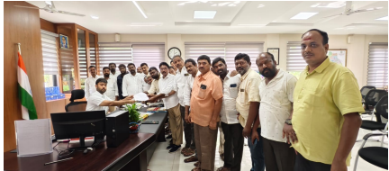
తొలి అక్షరం/ తోరూర్ రూరల్, అక్టోబర్ 18: ఈరోజు మహబూబాబాద్ జిల్లా కలెక్టర్ గారిని తోరూర్ మండల మరియు పట్టణ బిఆర్ఎస్ పార్టీ నాయకులు కలిసి వినతి పత్రం ఇవ్వడం జరిగింది. ప్రభుత్వ నిబంధనల ప్రకారం ఇందిరమ్మ కమిటీలు ప్రజలను భాగస్వామ్యం చేసి గ్రామసభలు మున్సిపాలిటీ వార్డు సభలు నిర్వహించి కమిటీ చేయవలసి ఉండగా అలాగే వేయాలని తోరూర్ ఎంపీడీవీ గారికి ఈనెల16 వ తారీఖున బి ఆర్ సి పార్టీ వినతిపత్రం ఇవ్వగా గ్రామసభలు నిర్వహించి