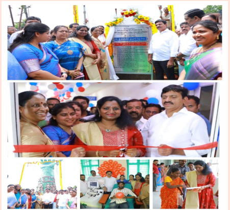
తొలి అక్షరం/హనుమకొండ ప్రతినిధి, సెప్టెంబర్ 17: వరంగల్ ఎంపీ ఎం.ఎం.ఎం. జంక్షన్ లో రూ. 60లక్షలతో చెప్పట్లిన అభివృద్ధి పనుల ప్రారంభోత్సవంలో మంత్రులు పొంగులేటి శ్రీనివాస్ రెడ్డి, కొండా సురేఖ గార్లతో కలిసి వరంగల్ పార్లమెంట్ సభ్యురాలు డాక్టర్ కడియం కావ్య పాల్గొన్నారు. అనంతరం ఎంజీఎం ఆస్పత్రిలో సింగల్ డోసర్ ఫ్లేట్ లెట్స్ (ఎన్ డి పి) బిల్డ్ బ్యాంక్, పిఎంఎస్ ఎస్ వై ఆస్పత్రిలో ఆధునికీకరించిన 14 పడకల డయాలసిస్ సెంటర్ ను మంత్రులతో కలిసి ప్రారంభించారు. అలాగే హనుమకొండ టిడిటి జంక్షన్ లో రూ. 50లక్షలతో చేపట్టిన అభివృద్ధి పనులను ప్రారంభించారు.