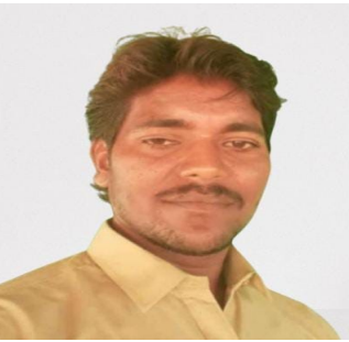
తొలి అక్షరం/చెన్నారావుపేట, సెప్టెంబర్ 17: