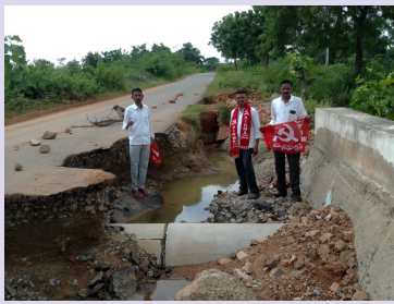
తొలి అక్షరం/సర్పంచలపేట, సెప్టెంబర్ 7: