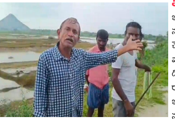
తొలి అక్షరం/సర్పంచలపేట, సెప్టెంబర్ 7:

- ఫోటోలోకే ఫోజులిచ్చిడా.? ఆగ్రహం వ్యక్తం చేస్తున్న మండల రైతులు