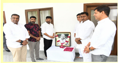
తొలి అక్షరం/స్వాధీనీ, ఆగస్టు 24: సాహితీవేత్త, తెలంగాణ సాయుధ పోరాట యోధుడు స్వర్ణీయ దాశరథి రంగాచార్య జయంతి సందర్భంగా ఆ బహుభాషా కోవిదుడికి ముఖ్యమంత్రి రేవంత్ రెడ్డి నివాళి అర్పించారు. ఢిల్లీలోని అధికారిక నివాసంలో పలువురు ప్రజాప్రతినిధులు, నాయకులతో కలిసి ముఖ్యమంత్రి ఏ.రేవంత్ రెడ్డి దాశరథి చిత్రపటానికి పుష్పాంజలి పులింపారు. తెలంగాణ సాయుధ పోరాటంలో స్వయంగా పాల్గొనడమే కాకుండా నాటి పరిస్థితులపై అనేక రచనలతో దాశరథి రంగాచార్య తెలుగు సాహిత్యాన్ని సుసంపన్నం చేశారని ముఖ్యమంత్రి గుర్తుచేసుకున్నారు. వేదాలను తెలుగులోకి అనువదించడం వంటి విప్లవాత్మక చర్యలతో దాశరథి రంగాచార్య చరిత్రలో తనదైన ప్రత్యేక స్థానాన్ని ఏర్పరుకున్నారుని ముఖ్యమంత్రి పేర్కొన్నారు.