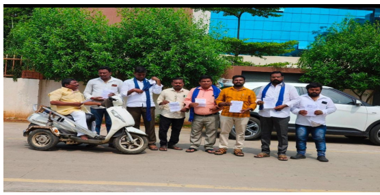
సంస్థలను దుకాణాలను సూపర్ మార్కెట్ ఫాపులను అన్నిటిని బంధు పెడుతూ స్తంభింప చేయాలని కోరుతూ ఎన్నో వర్గీకరణ

తొలి అక్షరం/రాష్ట్ర బ్యూరో(సాంబ),ఆగస్టు20: ఖమ్మం జిల్లా మాల మహానాడు నగర మాల మహానాడు కమిటీల నాయకులకు కార్యకర్తల ఆధ్వర్యంలో ఆగస్టు 21న ఎన్నో కులాల వర్గీకరణకు వ్యతిరేకంగా సుప్రీంకోర్టు ఇచ్చిన తీర్పును పునర్ పరిశీలించాలని కోరుతూ దేశవ్యాప్తంగా బంధును ప్రకటించడం జరిగింది. ఈ బంధును మాల సామాజిక వర్గం మొత్తం కూడా ప్రతి ఒక్క కార్యకర్త సైనికులు గా పాల్గొని 341 ఆర్టికల్ ను యాధా విధంగా కొనసాగించాలని డిమాండ్ చేస్తూ భవిష్యత్ ఉద్యమాలు చేయాల్సిన అవసరం మాల జాతి బుజాస్యందాల మీద ఉన్నది. జాతీయ నాయకత్వం ఇచ్చిన పిలుపులను విజయవంతం చేయుటకు అన్ని మండల కేంద్రాలలో జిల్లా సెంటర్లలో అన్ని రకాల వ్యాపార