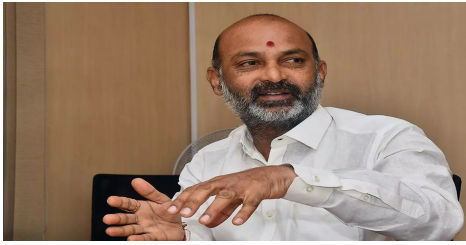
రుణమాఫీ ఒక బోగస్ అంటూ విమర్శించారు. ఆరు గ్యారంటీ స్కీమ్ల అమలుపై శ్వేత పత్రం విడుదల చేయాలని కేంద్రమంత్రి బండి సంజయ్ డిమాండ్ చేశారు.

కాంగ్రెస్, బిఆర్ఎస్లపై బండి విమర్శలు తొలి అక్షరం/కరీంనగర్, ఆగస్టు 20: అధికార పార్టీ కాంగ్రెస్, బిఆర్ఎస్ పార్టీలపై కేంద్ర హోంశాఖ సహాయ మంత్రి బండి సంజయ్ ఘాటు వ్యాఖ్యలు చేశారు. మంగళవారం మీడియాతో మాట్లాడుతూ.. రైతు రుణమాఫీ, ఆరు గ్యారంటీ స్కీమ్ల హామీలపై చర్చను దైవర్ష చేయడానికి విగ్రహాల లాభిని తెరవైకి తీసుకొచ్చారని మండిపడ్డారు. కాంగ్రెస్, బిఆర్ఎస్ల సవాళ్లు, ప్రతి సవాళ్లు ప్రజల దృష్టిని మళ్ళించడానికే అంటూ ఆగ్రహం వ్యక్తం చేశారు. రైతులు ఆందోళన చెందుతుంటే.. మీకు విగ్రహాల సమస్య వచ్చిందా అని ప్రశ్నించారు. విగ్రహాల సవాళ్లతో ఏమైనా ఉపయోగం ఉందా అని నిలదీశారు. రైతు