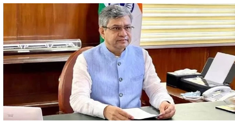
ఆందోల పాస్ ప్రాజెక్టుల పూర్తి చేశామని రైల్వే మంత్రి అశ్వినీ వైష్ణవ్ వివరణ ఇచ్చారు.

తొలి అక్షరం/స్వాధీర్షి, జూలై 24: కేంద్ర బడ్జెట్ లో తెలంగాణ రాష్ట్రానికి ఎటువంటి నిధుల కేటాయింపు లేదని రాష్ట్ర వ్యాప్తంగా విమర్శలు వెల్లువెత్తుతున్నాయి. ఇందులో భాగంగా తెలంగాణ అసెంబ్లీలో రాష్ట్ర ప్రభుత్వం కేంద్ర బడ్జెట్ కు వ్యతిరేకంగా తీర్మానాన్ని ప్రవేశ పెట్టి చర్చించింది. దీనిపై రైల్వే శాఖ మంత్రి అశ్వినీ వైష్ణవ్ బుధవారం స్పందించారు. తెలంగాణకు కేంద్రం పెద్ద మొత్తంలో నిధులు కేటాయించినట్లు పేర్కొన్నారు. 2023-24 ఆర్థిక సంవత్సరానికి గాను బడ్జెట్ లో కేవలం రైల్వే ప్రాజెక్టుల కోసం తెలంగాణ రాష్ట్రానికి రూ.5336 కోట్లు కేటాయించినట్లు తెలిపారు. ప్రస్తుతం రాష్ట్ర వ్యాప్తంగా రూ.32,946 కోట్లు విలువైన రైల్వే ప్రాజెక్టుల నిర్మాణం జరగుతున్నాయని గుర్తు చేశారు. అలాగే అమృత్ భారత్ స్కీమ్ కింది 40 రైల్వే స్టేషన్లను ఎంపిక చేశామని, 437