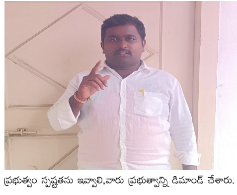
ప్రభుత్వం సృష్టించిన ఇప్పటివరకు ప్రభుత్వాన్ని డిమాండ్ చేశారు.

మాట్లాడుతూ,2017 జూన్ 20వ తేదీన గత ప్రభుత్వం గొర్రెకురుమలకు గొర్రెల పంపిణీ పథకాన్ని ప్రవేశపెట్టింది,ఇప్పటి వరకు సుమారు 4లక్షల మంది గొర్రె కురుమలకు గొర్రెల పంపిణీ జరిగింది,ఇంకా 3,37,816 మందికి గొర్రె కురుమలకు గొర్రెలు రావాల్సి ఉంది,మొత్తం స్కీం మీద సమగ్ర విచారణ చేపట్టాలి.బాధ్యులైన వారందరిపై చర్యలు తీసుకోవాలి, రాష్ట్ర వ్యాప్తంగా సుమారు 80 వేల మంది ఒక్కొక్కరు రూ.43,750 ల చొప్పున డిడిలు తీసి రెండేండ్లుగా గొర్రెల కోసం ఎదురు చూస్తున్నారు.కాంగ్రెస్ పార్టీ కూడా అసెంబ్లీ ఎన్నికల మేనిఫెస్టో లో 3నెలల్లో అందరికీ గొర్రెలిస్తామని వాగ్దానం చేసింది.కానీ ఇప్పటికీ అతీగతీ లేదు.గతం లో వలె అవినీతి అక్రమాలకు తావులేకుండా యూనిట్ మొత్తం నగదు బదిలీ ద్వారా పథకాన్ని అమలు చేయాలి.డిడిలు వాపస్ ప్రక్రియ నిలిపివేయాలి.రాష్ట్ర