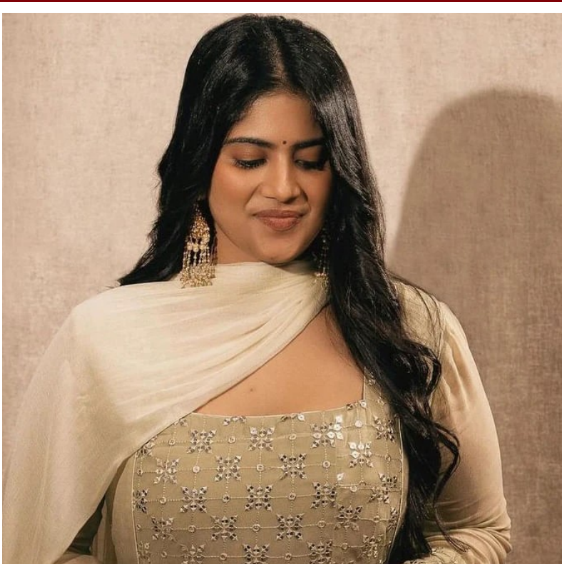
చిత్రాల్లో నటించింది. అందం, అభినయంతో నంతగా అవకాశాలు రావడం లేదు. ఇప్పటివ్పుడే తెలుగులో మాత్రం అశించి తమిళంలో కొన్ని లు చేస్తూ బిజీ అవుతుంది మేఘా.

తెలుగు సినీ పరిశ్రమలో తనకంటూ ఓ ఇమేజ్ క్రియేట్ చేసుకుంది హీరోయిన్ మేఘా ఆకాష్. ఇప్పటివరకు పలు చిత్రాల్లో నటించిన ఈ బ్యూటీకి అద్భుతమే కలిసి రావట్లేదు.అడపాదడపా చిత్రాల్లో నటించినా.. ఈ బ్యూటీకి టాలీవుడ్ ఇండస్ట్రీలో అవకాశాలు రావట్లేదు. కానీ ఈ అమ్మడుకు సోషల్ మీడియాలో ఓ రేంజ్ ఫాలోయింగ్ ఉంది. నిత్యం ఈ బ్యూటీ షేర్ చేసే ఫోటోస్, వీడియోస్ క్షణాల్లో వైరలవుతుంటాయి. తెలుగు సినీ పరిశ్రమలో తనకంటూ ఓ ఇమేజ్ క్రియేట్ చేసుకుంది హీరోయిన్ మేఘా ఆకాష్. ఇప్పటివరకు పలు చిత్రాల్లో నటించిన ఈ బ్యూటీకి అద్భుతమే కలిసిరావట్లేదు. అడపాదడపా చిత్రాల్లో నటించినా.. ఈ బ్యూటీకి టాలీవుడ్ ఇండస్ట్రీలో అవకాశాలు రావట్లేదు.కానీ ఈ అమ్మడుకు సోషల్ మీడియాలో ఓ రేంజ్ ఫాలోయింగ్ ఉంది. నిత్యం ఈ బ్యూటీ షేర్ చేసే ఫోటోస్, వీడియోస్ క్షణాల్లో వైరలవుతుంటాయి. తాజాగా ఈ బ్యూటీ షేర్ చేసిన క్యూట్ ఫోటోస్ నెట్టింట వైరల్ గా మారాయి. చుడిదారీ లో వద్దతిగా కనిపిస్తూ నెటిజన్లను మంత్రముగ్ధులను చేస్తుంది. తెలుగు ప్రేక్షకులకు ఇష్టమైన హీరోయిన్ మేఘా ఆకాష్. ముఖ్యంగా ఈ అమ్మాయికి కుర్రాళ్ల ఫాలో యింగ్ ఎక్కువే. యుంగ్ హీరో నిలిన్ నటించిన లై తో తెలుగు తెరకు పరిచయమైంది. కానీ ఈ మూవీ బాక్సా ఫీస్ వద్ద అంతగా ఆకట్టుకోకపోవడంతో ఈ బ్యూటీకి గుర్తింపు రాలేదు.ఆ తర్వాత ఛల్ మోహన్ రంగ, డియర్ మేఘా, ప్రేమదేశం, రాజ రాజ చోర, గుర్తుండా శీతాకాలం చిత్రాల్లో మెరిసింది. ఇటీవలే రావణాసుర లో నెగిటివ్ షేడ్స్ ఉన్న పాత్రలో నటించి మెప్పించింది.తెలుగుతోపాటు తమిళంలోనూ పలు