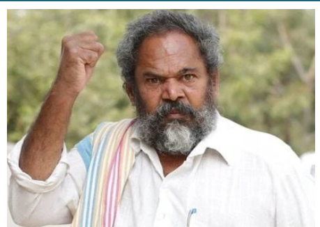
అందాకని చెందాద్దు.. అప్పీడు అగ్ని