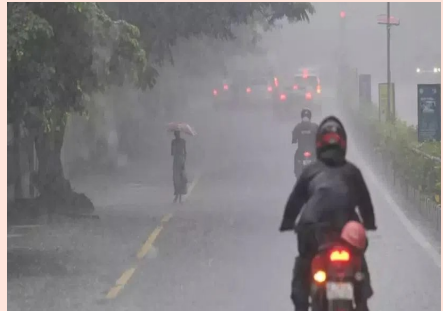
జిల్లాలో అక్కడక్కడ వర్షం కురిసింది.

తొలి అక్షరం/హైదరాబాద్, జూలై 12: రాష్ట్ర రాజధాని హైదరాబాద్ లోని పలు ప్రాంతాల్లో శుక్రవారం సాయంత్రం వర్షం కురిసింది. గత రెండు రోజుల నుంచి ఎండలు దంచికొడుతుం దలంతో.. ఉక్కపోతతో నగర వాసులు ఇబ్బంది పడుతున్నారు.