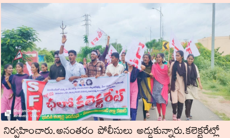
నిర్వహించారు.అనంతరం పోలీసులు అడ్డుకున్నారు.కలెక్టర్లపట్ల