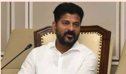
కమిషనరుల జెండా విడుదల చేసిన ప్రధాన కార్యదర్శి

తొలి అక్షరం/హైదరాబాద్, జూలై 12: సీఎం రేవంత్ రెడ్డి అధ్యక్షతన ఈనెల 16న సచివాలయంలో కీలక సమావేశం జరగనుంది. జిల్లా కలెక్టర్లు, ఎస్సీలు, పోలీసు కమిషనర్లతో నిర్వహించే రాష్ట్రస్థాయి కాన్ఫరెన్స్ లో పలు కీలక అంశాలపై చర్చించనున్నారు.