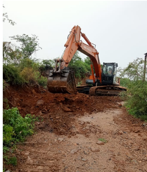
లంగా స్పందించాలి అని కోరడం జరిగింది. ఈ కార్యక్రమంలో గ్రామ నాయకులు, యువత, ప్రజలు పాల్గొనడం జరిగింది.

వాపోయారు. కాబట్టి ఇంకా వేరే ఇతర రైతులకి ప్రజలకి ఉపయోగపడే ఏదైనా సరే ఇక్కడ కట్టుకోవడానికి మాకు ఎలాంటి అభ్యంతరం లేదని వారు అన్నారు. కానీ రెవెన్యూ అధికారులు మాత్రం ఇక్కడ డంపింగ్ యార్డ్ కట్టడం లేదు బొందలు పూడ్చడానికే వచ్చాం అని మాట మార్చి సాకులు చెబుతున్నారని అంటూ ప్రజలంతా ఆగ్రహంతో ప్రశ్నించడంతో పనులు నిలిపివేసి అక్కడినుండి వెళ్ళిపోయారు. అనంతరం గ్రామస్థులు అంత కలిసి మరిపెడ లో ఉన్న రెవెన్యూ ఆఫీస్ కి వెళ్లి తమ భూమిలో ఎలాంటి డంపింగ్ యార్డ్ కట్టడానికి తమ అప్రతిపక్షంనూ ఒప్పుకోము అంటూ రెవెన్యూ అధికారికి వినతి పత్రాన్ని అందజేయడం జరిగింది. దానికి రెవెన్యూ డిపార్ట్మెంట్ వారు కూడా సానుకూ