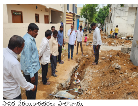
స్థానిక నేతలు, కార్యకర్తలు పాల్గొన్నారు.