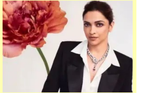
చాలు.. కేవలం బాలీవుడ్ హీరోయిన్లు మాత్రమే నటిస్తున్నారు.

నటించడం కొత్తే కాదు.. కానీ ఈ మధ్య ప్రతీ లోనూ బాలీవుడ్ బ్యూటీనే కనిపిస్తున్నారు. పేరుకు వాళ్లు ముంబై ముద్దుగుమ్మలే కానీ చూపంతా మాత్రం టాలీవుడ్ పైనే ఉంది. ఒక్కరో ఇద్దరో కాదు.. బాలీవుడ్ బ్యూటీస్ అంతా ఇప్పుడు తెలుగు వైపు పరుగులు తీస్తున్నారు. మన హీరోలు కూడా ఎక్కువగా నార్త్ హీరోయిన్స్ కావాలంటున్నారు. ఇటు ఎన్టీఆర్.. అటు రామ్ చరణ్.. హీరో ఎవరైనా జోడీ మాత్రం బాంబే భామే అంటున్నారు. తెలుగు లో బాలీవుడ్ హీరోయిన్లు నటించడం కొత్తే కాదు.. కానీ ఈ మధ్య ప్రతీ లోనూ బాలీవుడ్ బ్యూటీనే కనిపిస్తున్నారు. తాజాగా సెట్స్ పై ఉన్న దేవదత్ జాన్వీ కపూర్ హీరోయిన్.. తర్వాత సెట్స్ పైకి రానున్న రామ్ చరణ్, బుచ్చిబాబు లోనూ ఈ భామే హీరోయిన్ గా నటించబోతున్నారు. వీటితో పాటు సౌత్ ప్రాజెక్ట్ లో జాన్వీ పేరు వినిపిస్తుంది. విడుదలకు సిద్దమైన కల్పిలో దీపిక పదుకొనే మెయిన్ హీరోయిన్ కాగా.. రెండో హీరోయిన్ గా దిశా పటానీ కనిపిస్తున్నారు. ప్రభాస్ అంటే