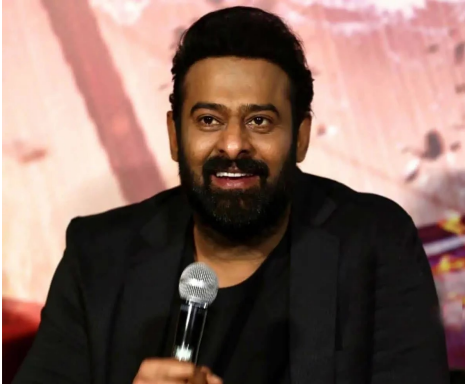
సినిమా థియేటర్ల రిలీజ్ కాబోతుంది. ప్రపంచవ్యాప్తంగా అన్ని

సినిమా ఇండస్ట్రీలో రికార్డులు క్రియేట్ చేయాలి అన్న ఆ రికార్డ్ బద్దలు కొట్టాలి అన్న స్టాద్ కే సాధ్యమవుతుంది. అలాంటి రికార్డ్ ను బ్రేక్ చేసే హీరోలు బద్దలు కొట్టలేరు. అయితే ఇప్పుడు ప్రభాస్ సాధించిన ఒక అరుదైన రికార్డ్ సోషల్ మీడియాలో బాగా ట్రెండ్ అవుతుంది. ఒకటి కాదు రెండు కాదు ఏకంగా 1428 కోట్లతో బాక్సాఫీస్ వద్ద ఊచకోత కోసిన క్రేజీ రికార్డ్ అందుకున్న తొలి ఇండియన్ హీరోగా సంచలన రికార్డులు నెలకొల్పాడు. దీంతో సోషల్ మీడియాలో ప్రభాస్ పేరు మారా మ్రోగిపోతుంది. నాగ్ అశ్వీన్ దర్శకత్వంలో ప్రభాస్ నటించిన లేట్స్ మూవీ కల్పి. దీపికా పదుకొనే - దిశా పటానిలు ఈ సినిమాల్లో హీరోయిన్లుగా నటించారు. అమితాబ్ చౌహాన్ కమల్ హాసన్ కీలకపాత్రలో నటించారు. అదేవిధంగా ఈ సినిమాలో విజయ్ దేవరకొండ - నాని లాంటి హీరోలు కూడా గెస్ట్ పాత్రలో నటించారు. అంతేకాదు ఒకప్పటి సీనియర్ హీరోయిన్ శోభన కూడా ఈ సినిమాలో ఇంపార్టెంట్ పాత్రలో కనిపించింది. మరి కొద్ది గంటల్లోనే ఈ