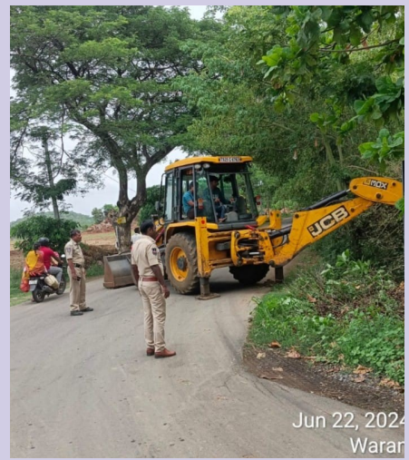
Jun 22, 2024 Warar

- ప్రమాదాలు జరగకుండా ముందస్తు చర్యలు - అభినందిస్తున్న నెక్స్ట్ ప్రజాసేవక