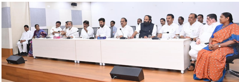
తొలి అక్షరం/హైదరాబాద్, జూన్ 21:

వినుతంగా వెలువడుతూ, విశేష ప్రజాధరణ పొందుతున్న తొలి అక్షరం తెలుగు దినపత్రికకు తెలంగాణ, ఆంధ్రప్రదేశ్ రాష్ట్రాల వ్యాప్తంగా అన్ని అసెంబ్లీ నియోజకవర్గాలలో విలేకరులు కావలెను. అసెంబ్లీ గల అభ్యర్థులు తమ బయోడేటాను tholiaksharam@gmail.com కి మెయిల్ చేయగలరు. సీనియర్లకు పాఠాస్యం, కొత్తవారికి కూడా అవకాశం, నియామకాలు జరుగుతున్నాయి వెంటనే సంప్రదించండి.