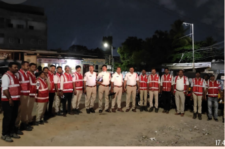
తొలి అక్షరం/శేరిలింగంపల్లి, జూన్ 17: ప్రత్యేక డ్రాక్ అండ్

- ఒకే రోజులో పట్టుపడిన 349 మంది నేరస్థులు