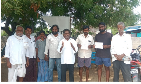
రెండు రోజులపాటు మండల స్థాయి రాజకీయ శిక్షణ తరగతులు నిర్వహిస్తున్నట్లు యొక్క శిక్షణ తరగతుల్లో కార్యకర్తలు పెద్ద ఎత్తున పాల్గొని జయప్రదం చేయాలని ఆయన పిలుపునిచ్చారు. రాజకీయ