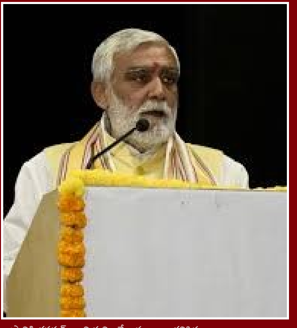
రాష్ట్రానికి గవర్నర్ గా నియమించే అవకాశాలు కనిపిస్తున్నాయి.

- దేశవ్యాప్తంగా గవర్నర్ల మార్పుకు రంగం సిద్ధం తొలి అక్షరం/న్యూఢిల్లీ, జూన్ 17 : జాతీయ రాజకీయాల్లో వేగంగా మార్పులు జరుగుతున్నాయి. అన్ని రాష్ట్రాల గవర్నర్లను మార్చడానికి రంగం సిద్ధమయింది. కేంద్రంలోని సంకీర్ణ ప్రభుత్వం రాష్ట్రాల గవర్నర్ల మార్పులు చేర్పులు చేయబోతోంది. ప్రస్తుతం తెలంగాణకు ఉన్న ఇన్ ఛార్జ్ గవర్నర్ సి.పి. రాధాకృష్ణన్ పొందిచ్చేరి, జార్ఖండ్ గవర్నర్ గా కొనసాగుతున్నారు. ఈ నేపథ్యంలో తెలంగాణకు మాజీ కేంద్ర మంత్రి అశ్వినీ కుమార్ చౌబే గవర్నర్ కాబోతున్నట్లు సమాచారం. ఇదిలావుండగా తెలంగాణలో అధికారంలోకి రావడమే లక్ష్యంగా బిజెపి పావులు కదుపుతోందని తెలుస్తోంది. మోడీకి అత్యంత నమ్మకస్థుడైన అశ్వినీ కుమార్ చౌబేను తెలంగాణ గవర్నర్ గా నియమించాలని భావిస్తున్నట్లు తెలుస్తోంది. ఆంధ్రప్రదేశ్, తెలంగాణ కలిసివున్నప్పుడు (ఉమ్మడి ఏపీ) ముఖ్యమంత్రిగా పనిచేసిన బిజెపి నాయకుడు కిరణ్ కుమార్ రెడ్డిని కర్ణాటక