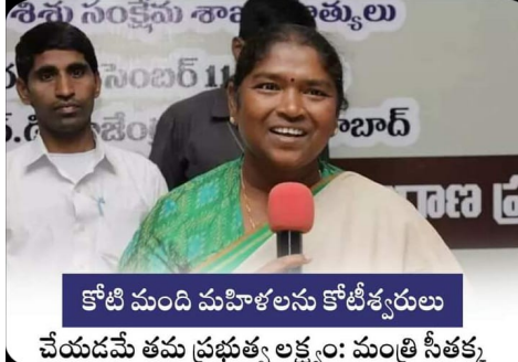
కోటి మంది మహిళలను కోటి శ్వరులు చేయడమే తమ ప్రభుత్వ లక్ష్యం: మంత్రి సీతక్క

తొలి అక్షరం/హైదరాబాద్, జూన్ 16 : మహిళా స్వయం సహాయక సంఘాలకు ఈ ఏడాది 20 వేల కోట్ల రుణాలు అందించాలన్న లక్ష్యాన్ని పెట్టుకున్నట్లు రాష్ట్ర పంచాయితీ రాజ్, గ్రామీణాభివృద్ధి మరియు మహిళా శిశు సంక్షేమ శాఖ మంత్రి డాక్టర్ ధనసరి అనసూయ (సీతక్క) తెలిపారు. గత ఏడాది కేవలం 15,400 కోట్ల రుణాలు ఇచ్చారని వెల్లడించారు. 2024-25 ఆర్థిక సంవత్సరం ప్రణాళికను సీతక్క శనివారం విడుదల చేశారు. అనంతరం ఆమె మాట్లాడారు. ఒకప్పుడు మహిళా సంఘాలకు రూ. పది వేల లోన్ ఇవ్వాలంటేనే బ్యాంకులు భయపడేవన్నారు. ఇప్పుడు మహిళా సంఘాలకు రూ. 20 లక్షల వరకు రుణాలు అందుతున్నాయన్నారు. మహిళా సంఘాలు మహిళల్లో ఆత్మవిశ్వాసాన్ని పెంచడమే కాదు. ఐక్యతను అభివృద్ధిని సాధిస్తున్నమని సీతక్క తెలిపారు. పేదలకు పేదలే బంధువులుగా ఉంటారన్నారు. అందుకే పేదలకు ప్రభుత్వమే అందగా ఉంది