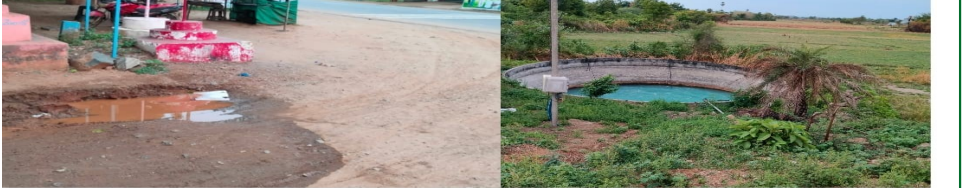
వెంటనే చర్యలు తీసుకోవాలని ప్రజలు ఆవేదన వ్యక్తం చేస్తున్నారు.