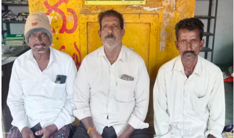
జీవిస్తున్నారు. ఎక్కువ విస్తరణలో మిర్చి పత్తి పంటలను సాగు చేస్తున్నారు. ఇదే అరుదుగా భావించిన విత్తన కంపెనీ వారు

రైతులను మోసం చేసేందుకు నకిలీ విత్తనాలను కల్పి పురుగు మందులు సరఫరా చేస్తూ రైతులను నిండా ముంచుతున్నారు. రాష్ట్ర వ్యవసాయ శాఖ మంత్రి తుమ్మల నాగేశ్వరావు ప్రత్యేక చొరవతో నకిలీ విత్తనాలపై కఠిన చర్యలు తీసుకోవాలని ఆయన కోరారు. శీతల గిడ్డంగుల్లో ఉన్న మిర్చికి గిట్టుబాటు ధర కల్పించాలని 25 వేల ఉన్న మిర్చి ధర 11 వేలకు దిగజారిందని మిర్చి రైతులను వెంటనే ఆదుకోవాలని ఆయన కోరారు. సన్న చిన్న కారు రైతులకు రాయితీల పై వ్యవసాయ యాంత్రికరణ పరికరాలను ప్రభుత్వం అందించాలని కోరారు. ఈ కార్యక్రమంలో మండల కాంగ్రెస్ నాయకులు దొడ్ల గురవయ్య, కాంపాటి వీరయ్య, టెంకటి వెంకటేశ్వర్లు, జాల మల్లయ్య, బండి వీరయ్య, జాల వెంకట నారాయణ, కాంపాటి వెంకన్న తదితరులు పాల్గొన్నారు.