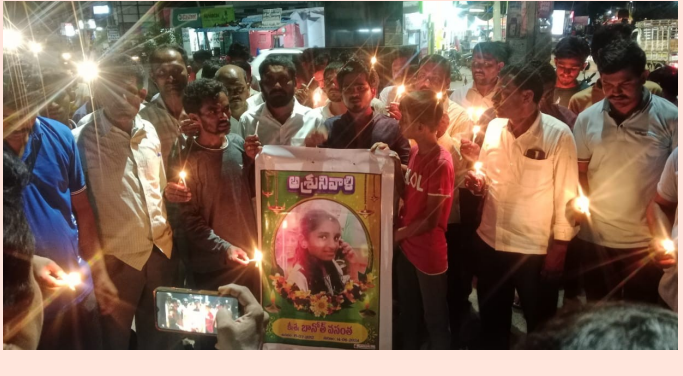
తొలి అక్షరం/మరిపేడ, జూన్ 15: మహబూబాబాద్ జిల్లా డోర్నకల్ నియోజకవర్గం మరిపేడ మండలం లో గిరిజన యువతిపై జరిగిన అత్యాచారానికి నిరసనగా గిరిజన యువకులు నాయకులు కొవ్వొత్తులతో నిరసన వ్యక్తం చేశారు. ఎల్లంపేట గ్రామ పరిధిలోని లక్ష్మ తండాకు చెందిన ఒక నిరుపేద కుటుంబం హైదరాబాద్, మియాపూర్, నడిగడ్డ తండా లో మైనర్ బాలిక పై అత్యాచారం ఆ పై హత్య ఆ పై దర్శం హైదరాబాద్ నడి బొడ్డు మీద మియాపూర్ నడి గడ్డ తండా లో ఘోర విషాదం శు క్రవారం అధ్యక్షం అయిన బాలిక పత్నించుకోని మియాపూర్ పోలీసు యంత్రాంగం ఈ నెల 14న శుక్రవారం ఉదయం