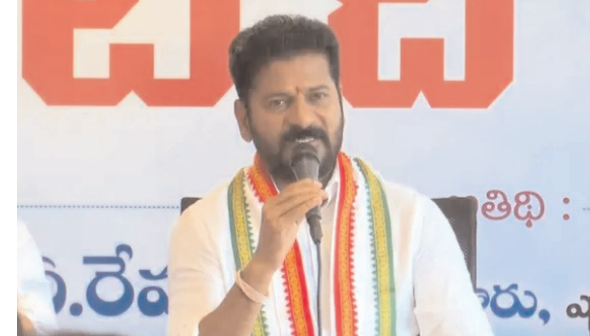
సమస్యలు తలెత్తకుండా చూడాలని సూచనలను రుణమాఫీకి విధివిధానాలు

హైదరాబాద్: ఒక్కో విద్యార్థిపై ప్రభుత్వం రూ. 80 వేలు ఖర్చు చేస్తోందన్న ముఖ్యమంత్రి డీఎస్సీ ద్వారా త్వరలో టీచర్ పోస్టులను భర్తీ చేస్తామని తెలంగాణ ముఖ్యమంత్రి రేవంత్ రెడ్డి అన్నారు. సోమవారం హైదరాబాద్ లోని రవీంద్రభారతిలో వందేమాతరం ఫౌండేషన్ ఆధ్వర్యంలో నిర్వహించిన పదో తరగతి ప్రభుత్వ పాఠశాలల టాపర్ విద్యార్థుల సన్మాన కార్యక్రమానికి సీఎం ముఖ్య అతిథిగా హాజరయ్యారు. ఈ సందర్భంగా వందేమాతరం ఫౌండేషన్ ను అభినందించారు. ప్రభుత్వ పాఠశాలల విద్యార్థులను ప్రోత్సహించడం అభినందనీయమన్నారు. ఇప్పుడు సర్వీసుల్లో ఉన్న ఐఎస్, ఐపీఎస్ లలో 90 శాతం మంది ప్రభుత్వ పాఠశాలల్లోనే చదివినట్లు సీఎం చెప్పారు. చాలా రాష్ట్రాల ముఖ్యమంత్రులు, మంత్రులు, కేంద్రమంత్రులు కూడా పాఠశాలల్లోనే చదివారన్నారు. గత కొంతకాలంగా ప్రభుత్వ పాఠశాలలు నిర్వహిస్తున్నారన్నారు. ఒక్కో విద్యార్థి మీద ప్రభుత్వం రూ. 80 వేలు ఖర్చు చేస్తోందన్నారు. కటాఫ్ డేట్ విషయంలో