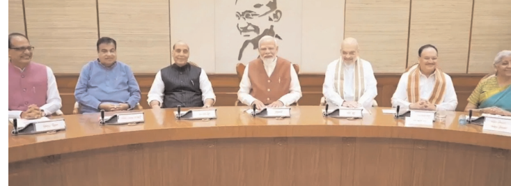
జులై తొలి విడతగా, ఆగస్టు- నవంబర్ రెండో విడతగా, డిసెంబర్-మార్చి మూడో విడతగా.. 2 వేల చొప్పున కేంద్రం ఈ ఆర్థిక సాయం అందిస్తోంది. కేంద్ర ప్రభుత్వం ఇప్పుటి వరకు పిఎం కిసాన్ పథకం ద్వారా 16 సార్లు నిధులు విడుదల చేసింది. ఇప్పుడు 17వ విడత నిధులు విడుదల కావాలి ఉంది. మోడీ సారి ప్రధానిగా బాధ్యతలు స్వీకరించిన మోడీ.. పిఎం కిసాన్ ఫైల్స్ చేసే తొలి సంతకం పెట్టడంతో త్వరలోనే డబ్బులు అకౌంట్ లో జమ కానున్నాయి. కాగా ఫైల్స్ చేసే

న్యూఢిల్లీ : కేంద్రంలో కొత్తగా ఏర్పాటైన ప్రధాని నరేంద్ర మోడీ నేతృత్వంలోని ఎన్డీఎ ప్రభుత్వం రైతులకు శుభవార్త తెలిపింది. పిఎం కిసాన్ పథకం కింద 17వ విడత రూ. 2వేల కోట్ల నిధుల విడుదలకు ఆమోదం తెలిపింది. దీంతో ఈ పథకం కింద ఉన్న రైతుల బ్యాంకు ఖాతాలకు త్వరలోనే నిధులు జమ కానున్నాయి. దేశ ప్రధానిగా వరుసగా మూడోసారి బాధ్యతలు స్వీకరించిన మోడీ సోమవారం పిఎం కిసాన్ సమ్మాన్ నిధి యోజన లబ్ధిదారులకు నిధుల విడుదలకు ఆమోదం తెలిపారు. తొలి సంతకం పిఎం కిసాన్ నిధుల విడుదలకు సంబంధించిన ఫైల్స్ చేశారు. దీని తో ఈ పథకం కింద మొత్తం 9.3 కోట్ల రైతులకు లబ్ధి చేకూరుతుంది. రైతులకు ఆర్థిక భరోసా కల్పించేందుకు కేంద్ర ప్రభుత్వం 'ప్రధానమంత్రి కిసాన్ సమ్మాన్ నిధి' అనే పథకాన్ని తీసుకొచ్చింది. 2019 ఫిబ్రవరి లో ఈ పథకాన్ని అమలులోకి తీసుకొచ్చింది. ఈ స్కీమ్ ద్వారా రైతులకు పంట సాయం ఎక్కడానికి ఏటా 6 వేల రూపాయలు అందిస్తోంది. ఈ 6 వేల రూపాయలను సంవత్సరానికి మూడు విడతలుగా నేరుగా రైతుల అకౌంట్ లో జమ చేస్తూ వస్తోంది. ఏప్రిల్-