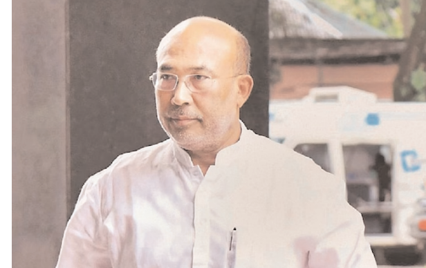
పోలీసు బెటేరియోలు, ఓ సెన్సైటివ్ బీట్ ఆఫీసు, 70 ఇళ్లకు నిప్పు పెట్టారు. దీంతో వందలాది మంది ప్రజలు ఆ ప్రాంతం నుంచి తరలిపోయారు. కాగా, ఈ నెల 6న గుర్తుతెలియని దుండగులు స్థానికంగా ఉండే ఓ వ్యక్తిని అతి కిరాతంగా హతమార్చడంతో జిరిబమ్ లో గత కొన్ని రోజులుగా అశాంతి నెలకొంది. ఈ నేపథ్యంలో ఆ ప్రాంతాన్ని ముఖ్యమంత్రి సందర్శించాలని అనుకున్నారు. ఈ క్రమంలో ఈ ఘటన చోటు చేసుకోవడం కలకలం సృష్టించింది.

- కంగ్ పోకిపి జిల్లాలో సోమవారం ఉదయం ఘటన - దాడిలో సెక్యూరిటీ సిబ్బంది ఒకరికి గాయాలు - ఇటీవల హింస చోటుచేసుకున్న జిరిబమ్ కు కార్యక్రమం వెళ్తున్న సమయంలో దాడి మణిపూర్ ముఖ్యమంత్రి ఎన్ బీరేన్ సింగ్ సెక్యూరిటీ కార్యక్రమంపై అనుమానిత మిలిటెంట్ల దాడికి పాల్పడ్డారు. కంగ్ పోకిపి జిల్లాలో సోమవారం ఉదయం ఈ దాడి జరిగింది. దాడిలో సెక్యూరిటీ సిబ్బంది ఒకరు గాయపడినట్లు పోలీసులు వెల్లడించారు. ఇటీవల హింస చోటుచేసుకున్న జిరిబమ్ జిల్లాకు రేపు ముఖ్యమంత్రి వెళ్ళాల్సి వుంది. ఈ క్రమంలో భద్రతా ఏర్పాటు పర్యవేక్షణ కోసం కార్యక్రమం వెళ్తున్న సమయంలో దాడి జరిగినట్లు తెలిపారు. రక్షణ దళాలపై మిలిటెంట్లు పలుమార్లు కాల్పులు జరిపారు. వెంటనే అప్రమత్తమైన భద్రతా బలగాణ అ దాడిని తిప్పికొట్టారు. జాతీయ రహదారి 53పై ఉన్న కొట్లైన్ గ్రామం వద్ద ప్రస్తుతం ఎదురుకాల్పులు జరుగుతున్నట్లు సమాచారం. ఎదురుకాల్పుల్లో మిల్లెట్ల గాయాల వల్ల ఒక జవాన్ గాయపడ్డారు. సీఎం బీరేన్ సింగ్ ప్రస్తుతం ఢిల్లీలో ఉన్నారు. ఆయన ఇంకా ఇంఫాలోకు చేరుకోవాలి ఉంది. జిరిబమ్ కు ఆయన వెళ్తున్నారని. శనివారం రోజున మిలిటెంట్లు రెండు