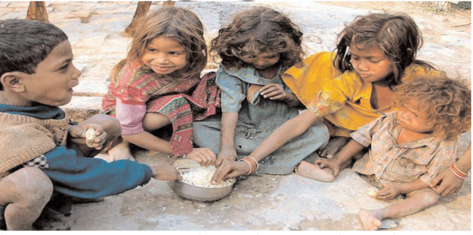
పేదరికాన్ని పెంచిన నయా ఉదారవాదం %మీపా 28,2024 05:35