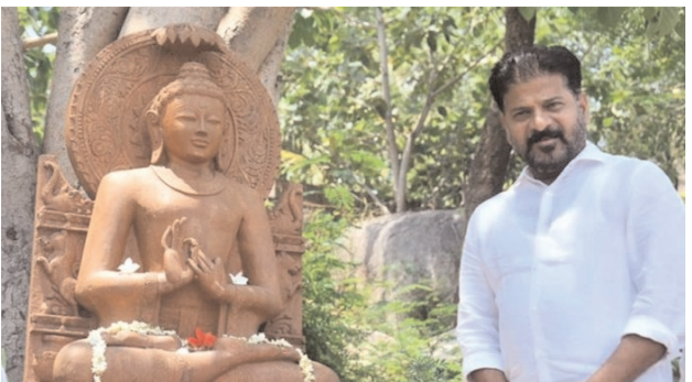
హైదరాబాద్: తెలంగాణలో బౌద్ధ విక్షులకు తగిన గౌరవం ఉంటుందని ముఖ్యమంత్రి రేవంత్ రెడ్డి వ్యాఖ్యానించారు. రాజ్యం, అధికారం ఉండి వాటిని కాదని 29 ఏళ్ల వయసులో కాంగ్రెస్ కోసం బుద్ధుడు ఆలోచించారన్నారు.

రెండున్నర వేల సంవత్సరాలూ బౌద్ధ సిద్ధాంతం నిలబడి ఉందని ఉద్ఘాటించారు. బుద్ధ పూర్ణుల సంవత్సరంగా సికింద్రాబాద్ లోని మహా బుద్ధ విహారాన్ని గురువారం సందర్శించారు. ఈ సందర్భంగా సీఎం రేవంత్ రెడ్డి మాట్లాడుతూ... గొప్ప క్షేత్రాన్ని సందర్శించిన అనుభూతి కలిగిందని తెలిపారు. ప్రతి పనిని ధ్యానంగా చేయాలన్న సూచనలో చాలా అర్థం ఉందని ఈ సూక్తిలో నుంచి ఎంతో స్ఫూర్తిని పొందానని చెప్పారు. ఏ పని అయినా తాను ఎంతో ధ్యానంగా చేస్తానని స్పష్టం చేశారు. ధ్యాన మందిరం కోసం స్పెషల్ డెవలప్ మెంట్ ఫండ్ నుంచి నిధులు మంజూరు చేస్తానని అన్నారు. ఒక పాఠశాలను నిర్వహించాలని తాను కోరుతున్నానని చెప్పారు. సమాజంలో అసహనం, అసూయ పెరిగిపోతున్నాయన్నారు. సమాజంలో స్పృహలు, ఉద్యోగాలు పెరిగేలా వాతావరణం నెలకొని ఉండాలన్నారు. బుద్ధుని సందేశం దేశానికి ఇప్పుడు ఎంతో అవసరమన్నారు. బుద్ధుడి సందేశాన్ని సమాజంలో ప్రతి ఒక్కరికీ చేరవేయడానికి అవసరమైన సహాయాన్ని అందిస్తామని తెలిపారు. ఈ ప్రభుత్వం మీది అన్ని రకాల సహాయ సహకారాలు ఉంటాయని సీఎం రేవంత్ రెడ్డి తెలిపారు.