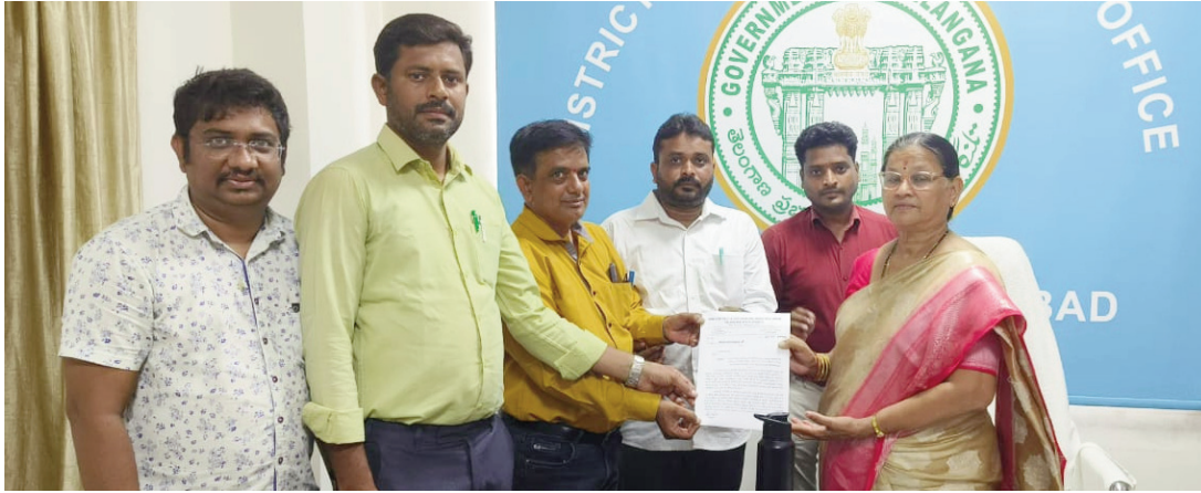
కార్యకుల పరిస్థితి దయానంగా మారింది.ఇంటికి రాయిలు,పిల్లల ఫీజులు,కుటుంబ పోషణ కష్టం మారింది.ఈ విషయంలో అనేక సందర్భాలలో జిల్లాస్థాయి అధికారులకు వినతి పత్రం ఇవ్వడం జరిగింది.కానీ నేటి వరకు కూడా జీతాలు అందలేదు. అనగా మే 23 నెలలో ఒకటవ తేదీన అందాల్సిన జీతాలు ఈరోజు దాకా అందకుం