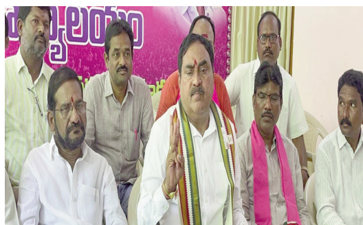
శాతం మంది రైతులు మాత్రం వారి కుటుంబ ఆవసరాల కోసం మిగిలింది అమ్ముకునే వారు ఉన్నారు. అప్పుడు ప్రతివక్తలో ఉన్నప్పుడు రేవంత్ రెడ్డి తెలంగాణలో అధిక శాతం దొడ్డు వడ్డ పండించాలని దొడ్డు వడ్డకు మద్దతు ధర ఇవ్వాలని నేడు అధికారం లోకి రాగానే కేవలం సన్నబడ్డకు మాత్రమే మద్దతు ధర ఇస్తామని అనడం వారి బోగస్ మాటలకు నిదర్శనం అని ఎర్రబెల్లి చేశారు