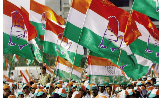
నుండి పలు హామీలతో కాంగ్రెస్ పార్టీలోకి వచ్చిన కొత్త నాయకులకు మద్దతు వర్గ విభేదాలతో పల్లెలు భగ్గుమంటున్నాయి. ప్రతి గ్రామంలో గ్రామ ప్రభుత్వ పౌరుల స్థానం కల్పిస్తారని అధిష్టాన హామీలతో పార్టీలో చేరామని మనకు సర్పంచ్ సీటు రావడం ఖాయమని

-సమరం మొదలు కాకముందే కాంగ్రెస్ పార్టీలో వర్గ పోరు -పాత నాయకులకు అవమానం -కొత్త నాయకులకు స్వాహాని ఇస్తున్నారని పార్టీ కార్యకర్తలు గుసగుస