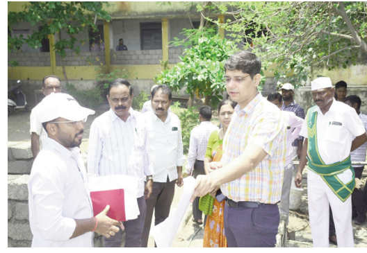
ఆదేశించారు. విద్యుత్, ట్రాగునీరు, మరుగుదొడ్లకు నీటి సరఫరా, స్టాబ్, ప్రహారీ గోడల నిర్మాణం, మరమ్మత్తులు చేపట్టాలని సూచించారు. మహిళా సంఘాలు, విద్యాశాఖ అధికారులు పనులను

తొలి అక్షరం/గార్ల ప్రతినిధి(సైదులు),మే21:నాణ్యత ప్రమాణాలు పాటిస్తూ అమ్మ ఆదర్శ పాఠశాల పనులను పాఠశాలల పునః ప్రారంభం లోగా పూర్తి చేయాలని జిల్లా కలెక్టర్ ఆశిష్ సాంగ్వాన్ అధికారులను ఆదేశించారు. నిర్మల్ లోని స్థానిక ఎన్టీఆర్ స్టేడియం సమీపంలోని ప్రభుత్వ బాలర ఉన్నత పాఠశాల లో చేపట్టిన పనులను ఆయన మంగళవారం పరిశీలించారు. ఈ సందర్భంగా ఆయన మాట్లాడుతూ... ప్రభుత్వ పాఠశాలలలో అమ్మ ఆదర్శ పాఠశాల కమిటీల ద్వారా చేపట్టిన పనులను నాణ్యత ప్రమాణాలు పాటించి విడుదల పునః ప్రారంభానికి ముందే పూర్తి చేయాలని