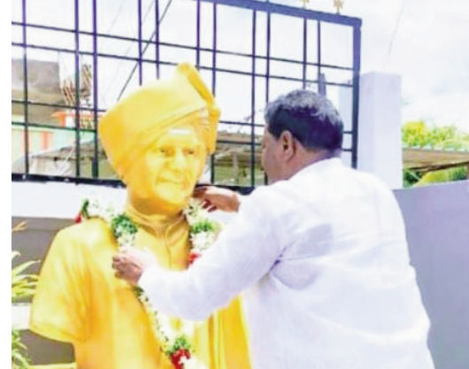
అధ్యక్షులు, ట్యాక్ కాంగ్రెస్, మండల నాయకులు, తిమ్మారాయన పాడు గ్రామ పెద్దలు, మత బోధకులు, కాంగ్రెస్ గ్రామ శాఖ అధ్యక్షులు తదితరులు పాల్గొన్నారు.