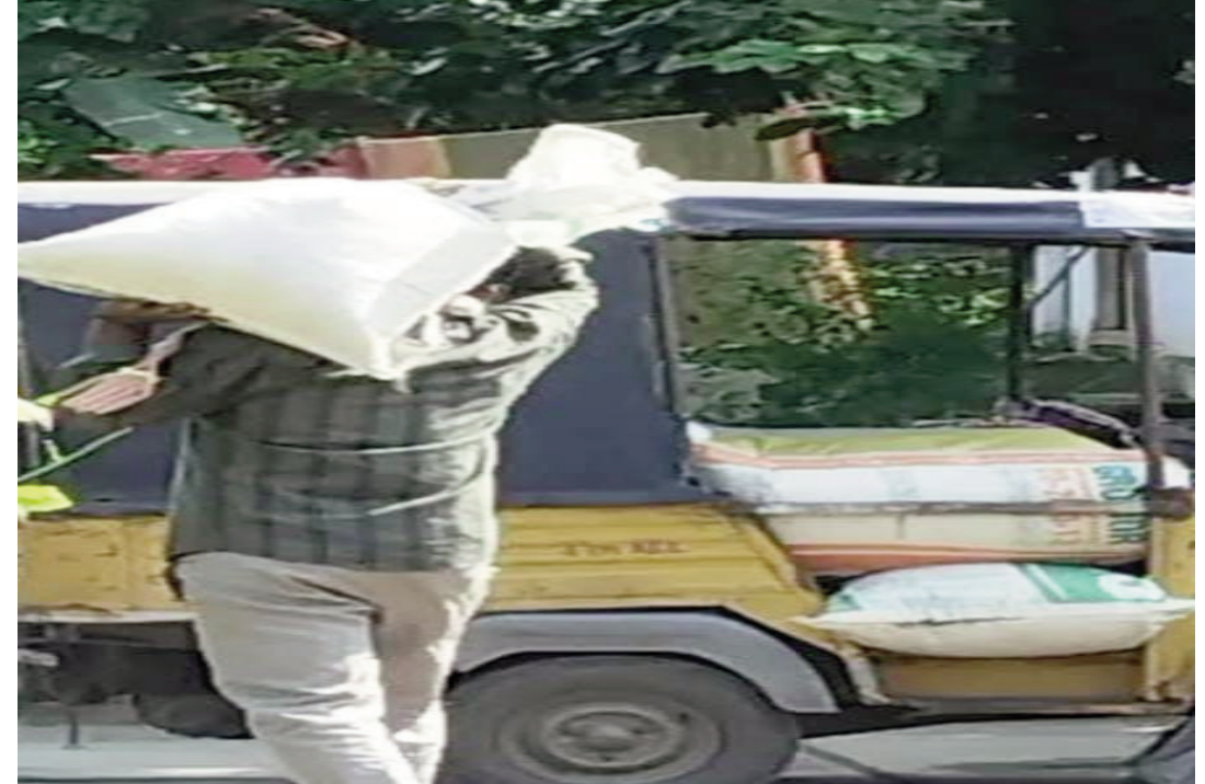
దండా వ్యాపారులు అడిందే అట..పాలిందే పాటగా మారుతోంది.ఇప్పటికైనా సంబంధిత అధికారులు రేషన్ బియ్యాన్ని సేకరించి బ్లాక్ మార్కెట్ లో అమ్ముతున్న అక్రమార్కులపై అధికారులు కఠిన చర్యలు తీసుకోవాలని పలువురు కోరుతున్నారు.